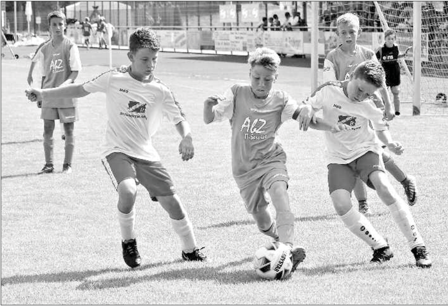
Das Spiel zwischen Flöha (rot-weiß) und Niederwiesa (grün) endete 0:0.