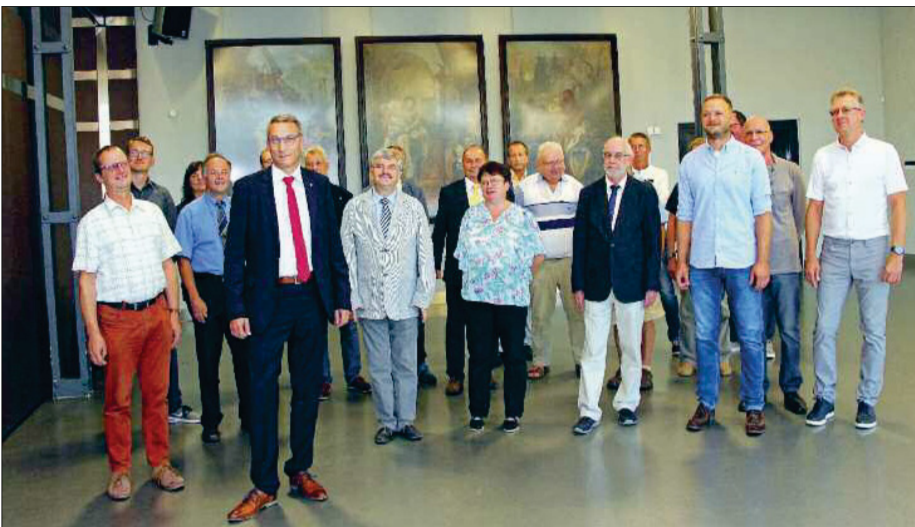
Die neuen Stadträtinnen und Stadträte des Stadtrates Flöha zur ihrer konstituierenden Sitzung am 22. August 2019.

Zur ersten Stadtratssitzung nach den Kommunalwahlen vom 26. Mai 2019 fanden sich die Abgeordneten am 22. August 2019 zu ihrer konstituierenden Sitzung zusammen.