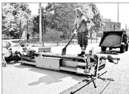
Zwei Mitarbeiter der Firma Arena Sportbodensysteme Herford bringen den Kunststoffbelag in Flöha-Plaue auf.

Im Auenstadion sowie der Kleinsportanlage an der Oberschule sind durch eine Fachfirma aus Herford im August Laufbahnen und Spielflächen saniert worden. Insbesondere wurde an der Sportanlage in Plaue der verschlissene Kunstrasenbelag durch eine spezielle Kunststoffschicht ersetzt, die haltbarer und pflegeleichter ist, als der bisherige Belag. Im Auenstadion wurde die Laufbahn erneuert. Im Laufe der Zeit hatten sich dort an verschiedenen Stellen Risse gebildet, zudem löste sich teilweise der Belag ab. "Diese