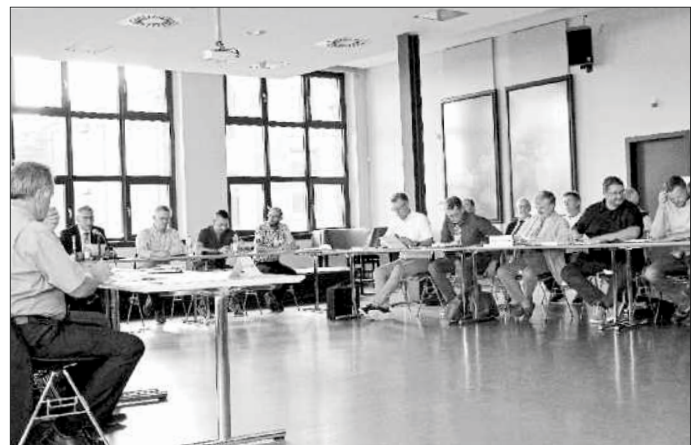
Der neue Flöhaer Stadtrat zu seiner konstituierenden Sitzung am 22.08. August 2019.

Dass die Arbeit eines Stadtrates keine leichte Aufgabe sein wird, bekamen die Räte bereits in ihrer ersten Sitzung zu spüren. Die Räte mussten sich den Mehrausgaben von 1 Mio. Euro durch Kostensteigerung beim Neubau der Kirchenbrücke stellen. Da der Fördermittelgeber derzeit keine Zusage geben konnte, dass diese Kostensteigerung bezuschusst werden kann, bereitete dieser Beschluss einigen Stadträten Bauchschmerzen. Letztlich war man sich mehrheitlich darüber einig,